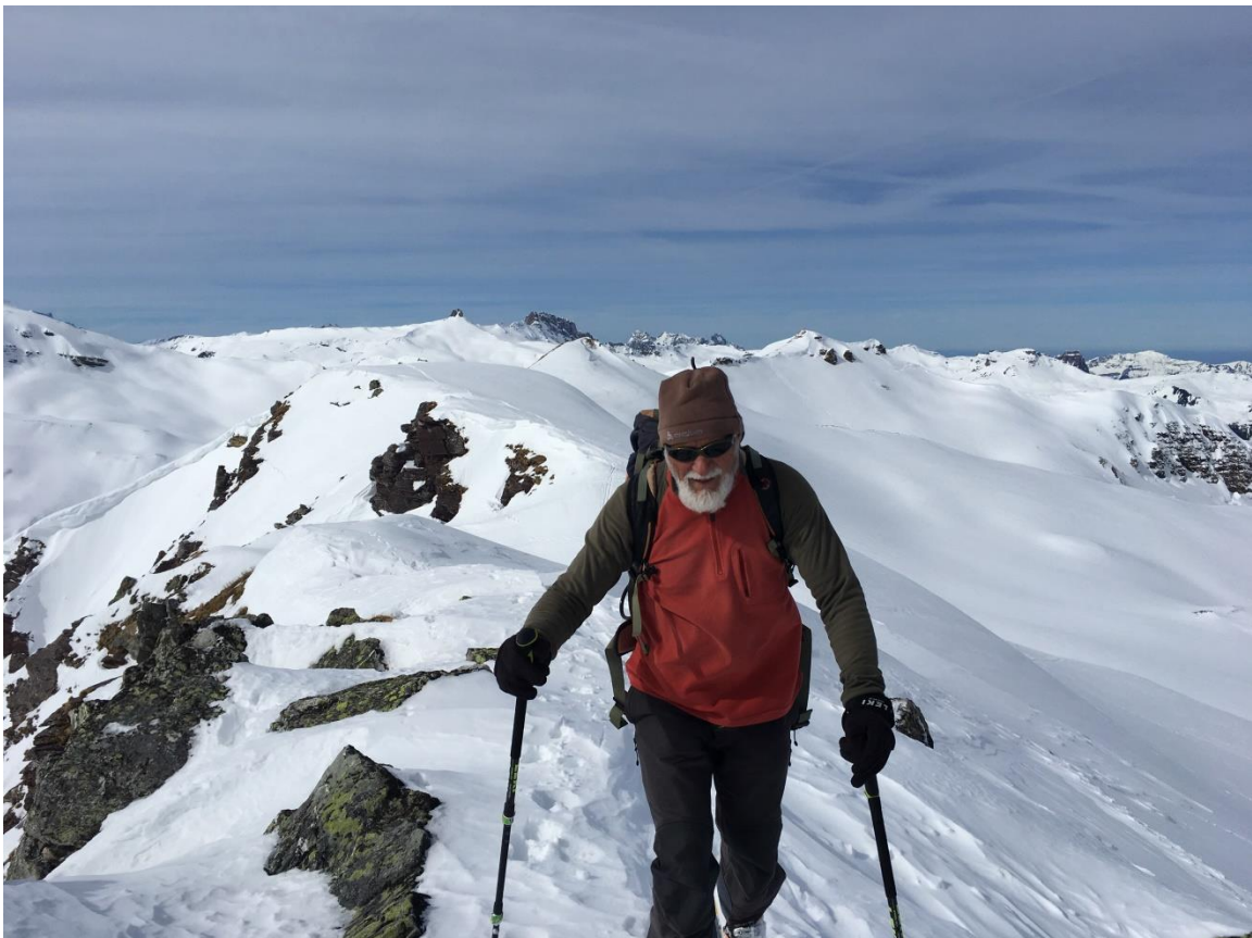
Galans 2338 m. Im Hintergrund der Spitzmeilen und die Flumserberge.