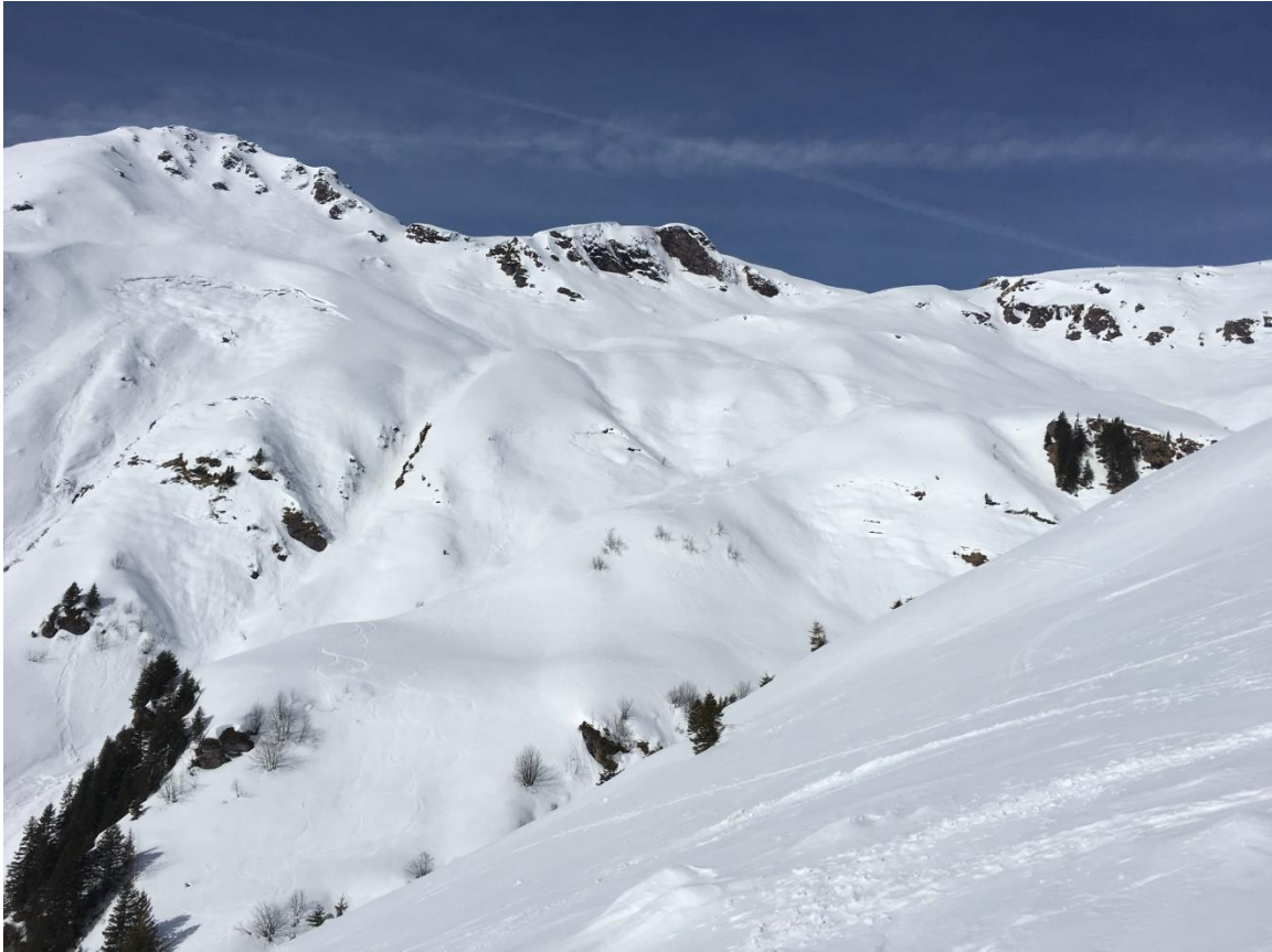
Ober Galans. Der Gipfel rechts im Bild ist unser Ziel.