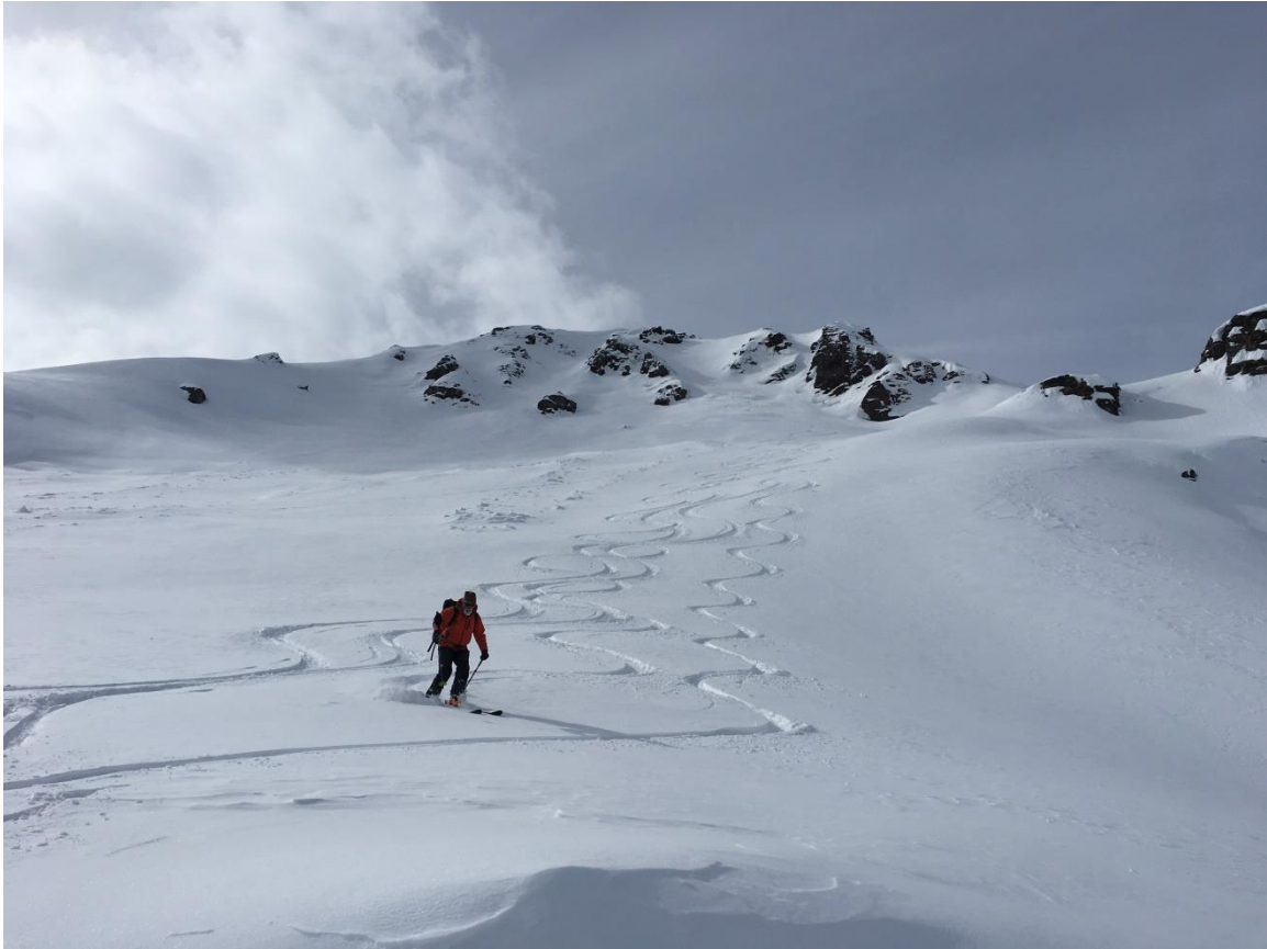
Abfahrt vom Galans.