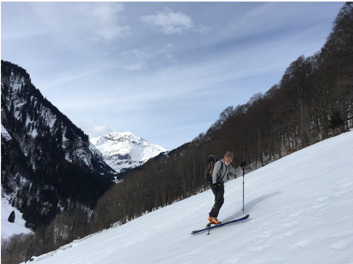
Gadmen mit Foostock im Hintergrund