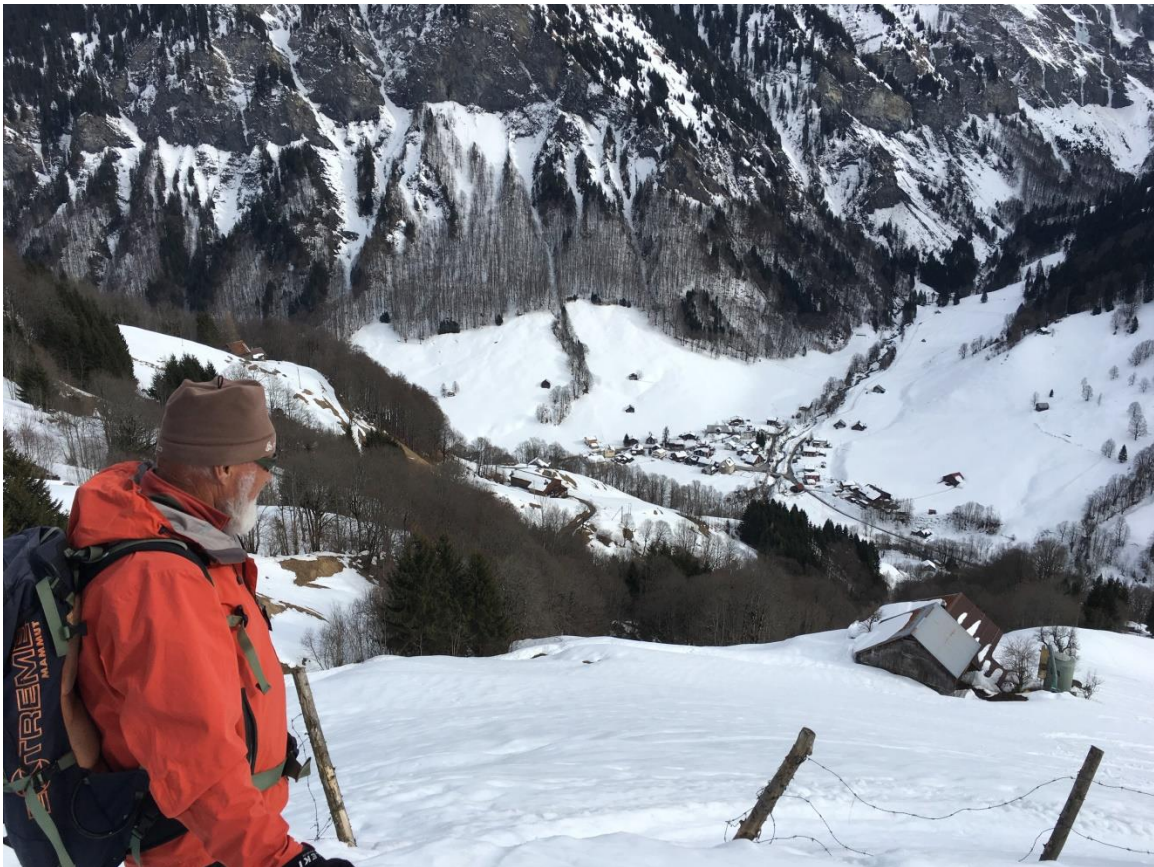
Rogara. Blick ins Weisstannen Oberdorf.