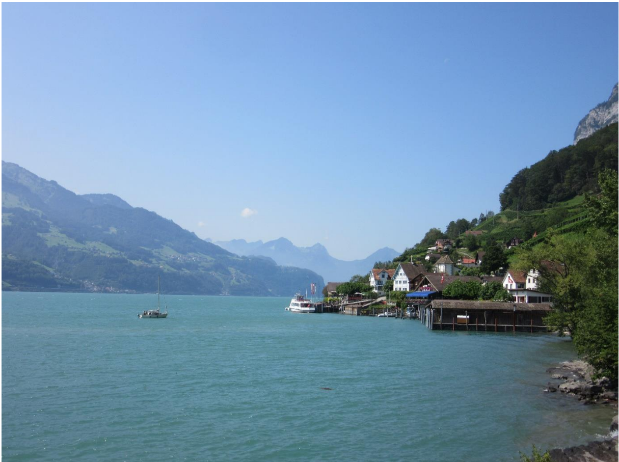
Blick zurück nach Quinten