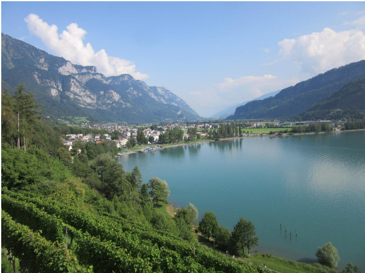
Blick auf Walenstadt