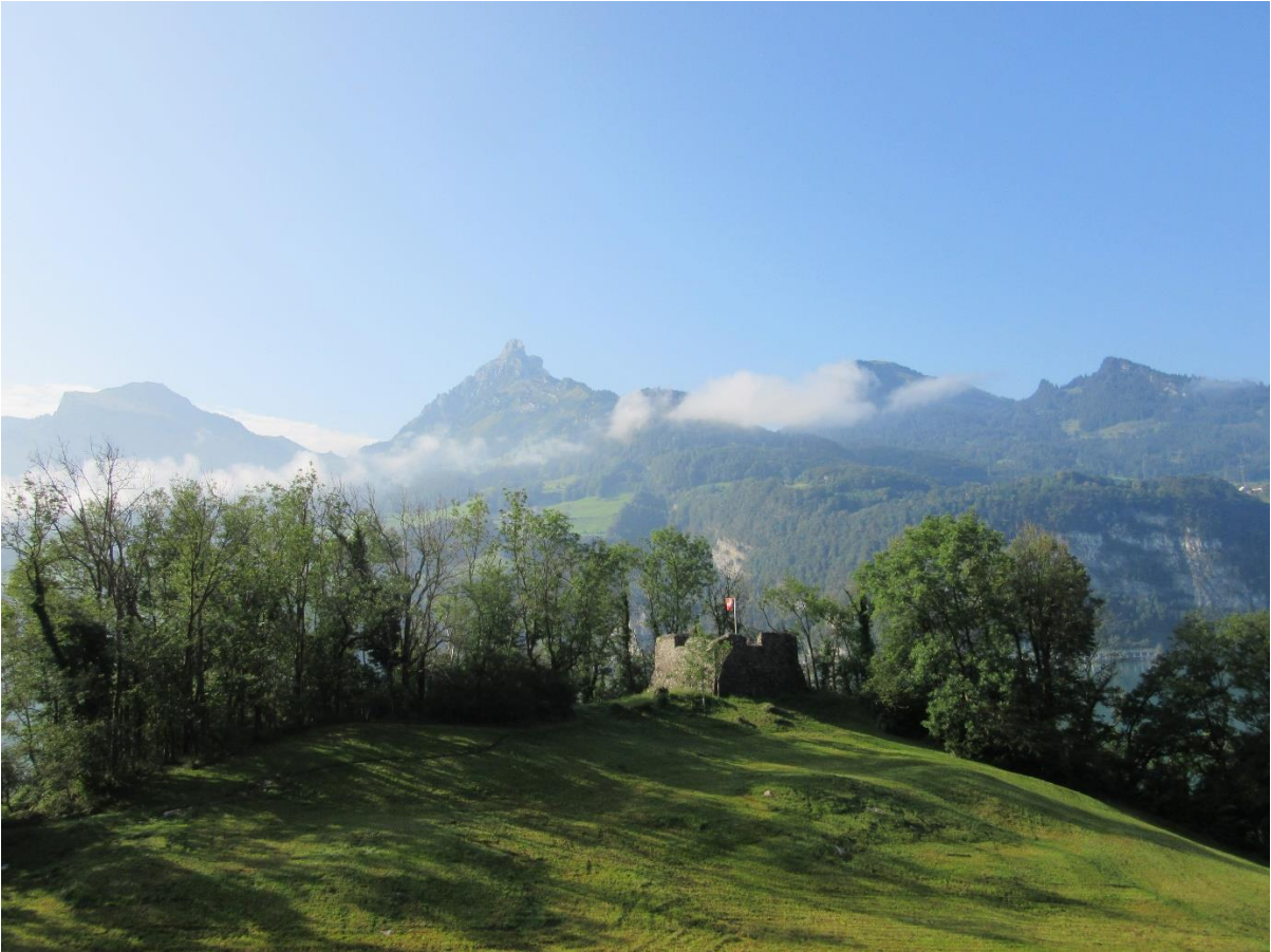
Die Ruinen eines alten Wehrturmes