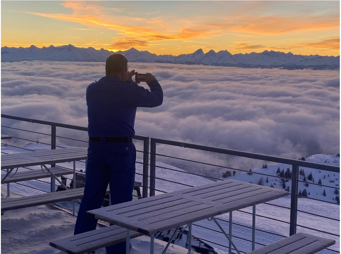
Renè fängt die Morgenstimmung ein