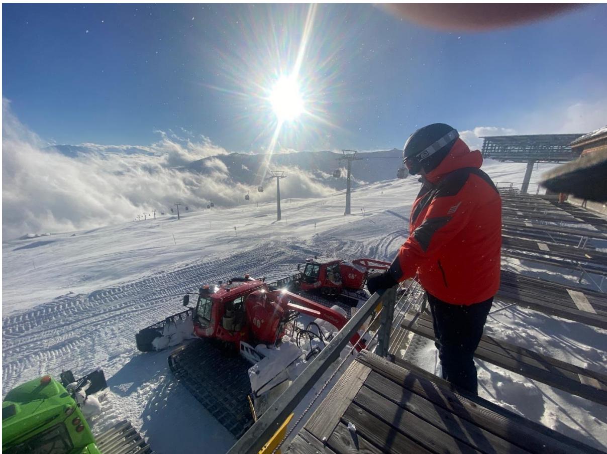
Warten auf den nächsten Einsatz