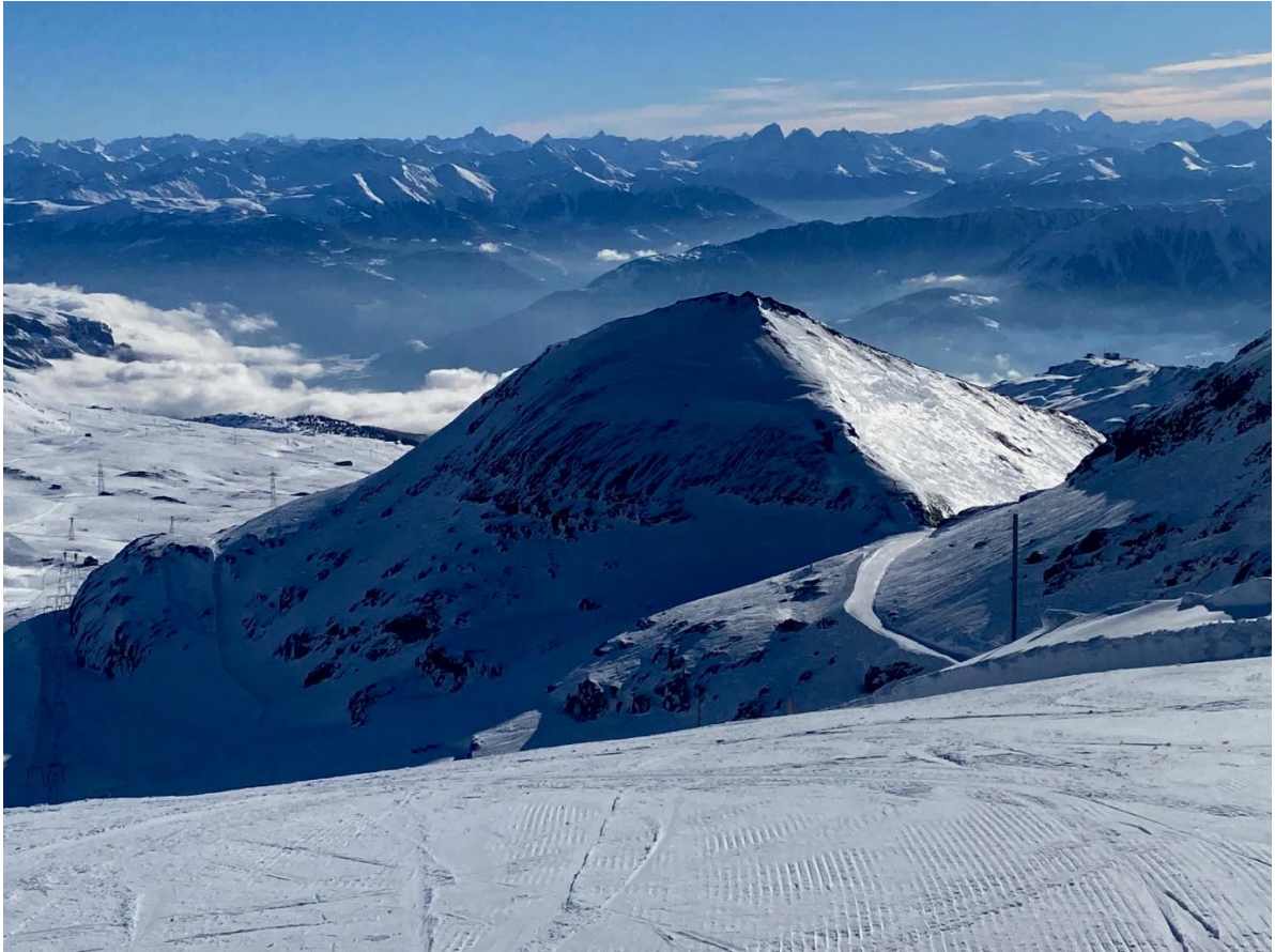
Auf dem Vorabgletscher