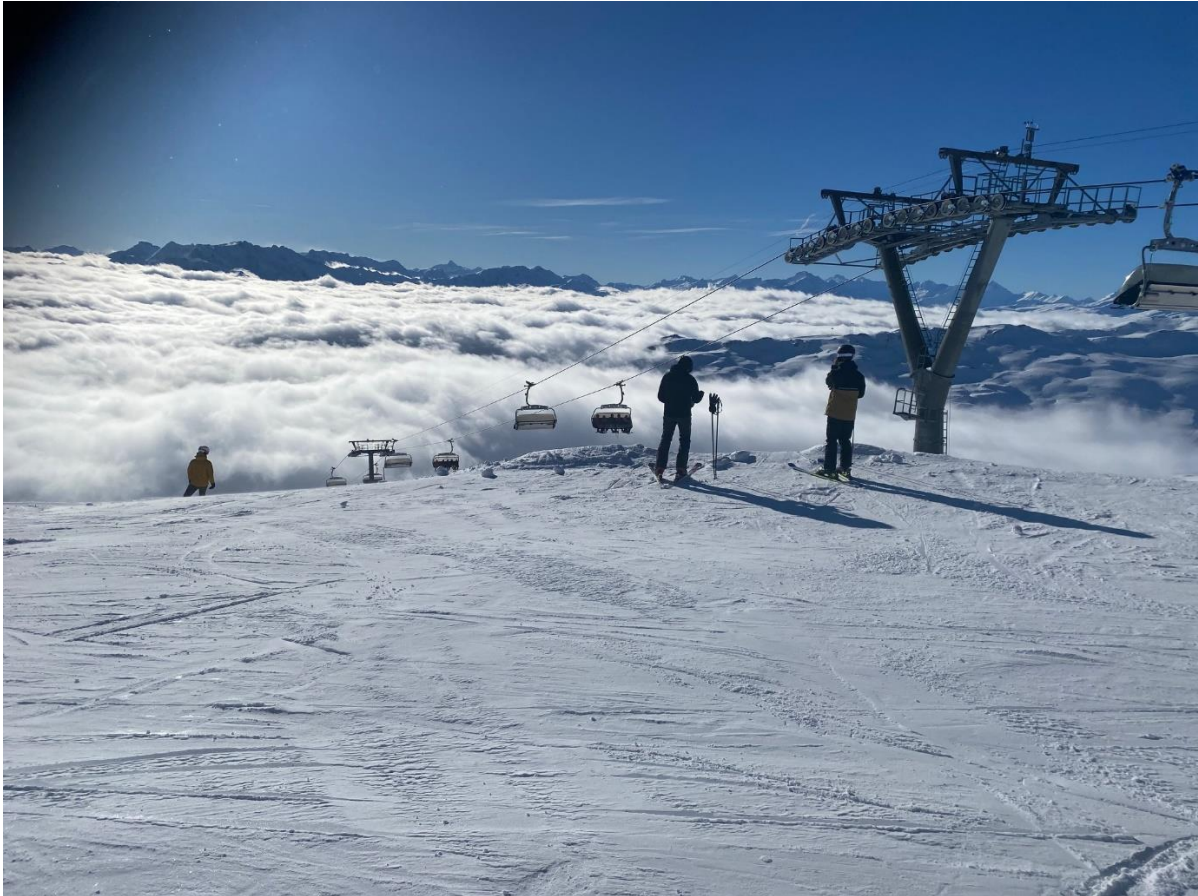
Am ersten Tag, fährt nur mit den oberen Liften