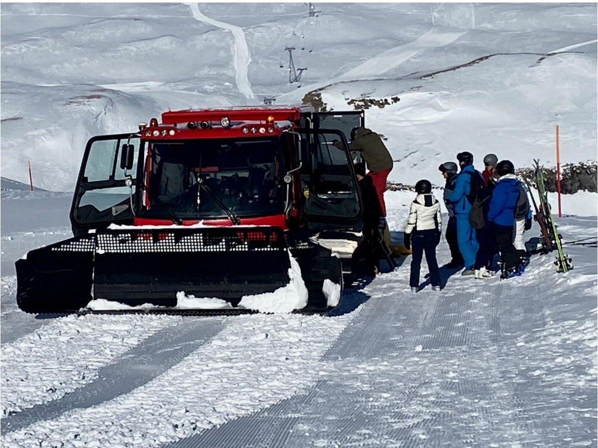
Darauf hätten sie wohl verzichten können